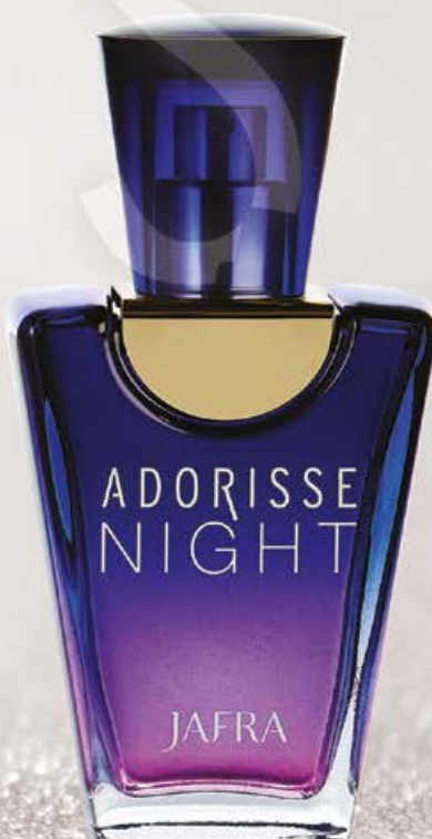
Adorisse Passion PARA A MULHER INTENSA

Mistura da maçã vermelha, chá de jasmim indiano e merengue de red velvet