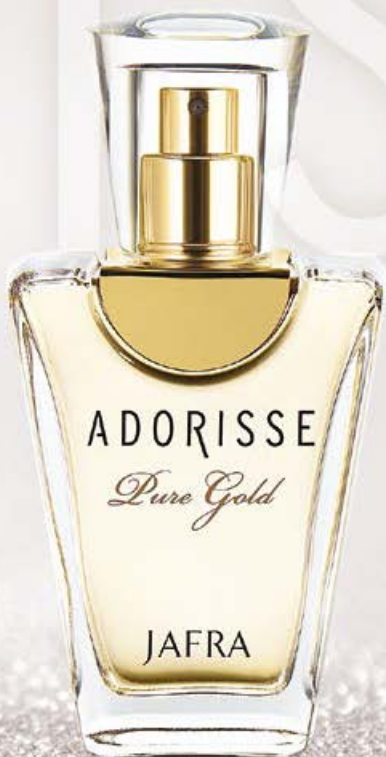
Adorisse Pure Gold PARA A MULHER EXTRAORDINÁRIA

Notas de tangerina combinadas com lírio do vale e âmbar