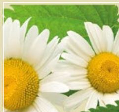
ÓLEO DE CAMOMILA

Argilas absorvem o excesso de oleosidade, desintoxicam e minimizam os poros da pele