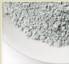
CAULIM E BENTONITA

Argilas absorvem o excesso de oleosidade, desintoxicam e minimizam os poros da pele